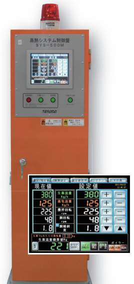
蒸热系统控制盘 SYS-500M (可选择附件)