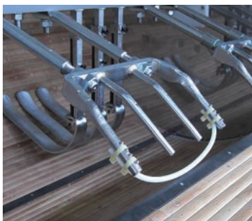
带硅胶软管的抄手