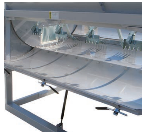
前后都能开得很大的清扫用门