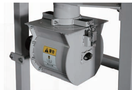
从旋转阀门只放出茶毛。