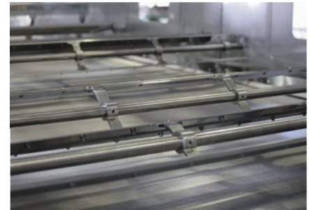
不锈钢网状输送带和搅拌装置